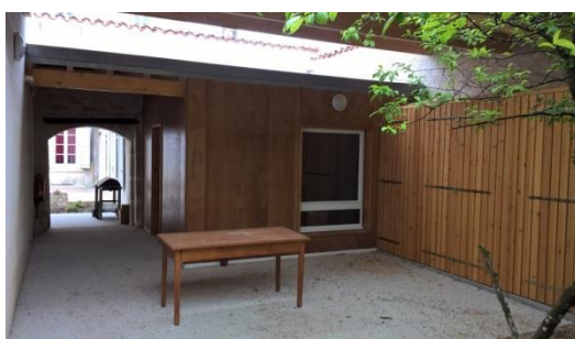
Salle commune du domicile groupé de Jarnac

Le Montant global de l'opération pour la partie logement est de 415 000 €