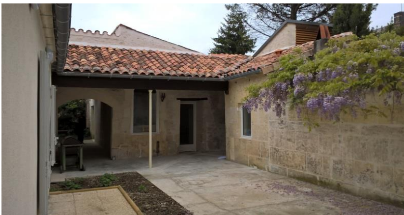
Domicile regroupé de Jarnac