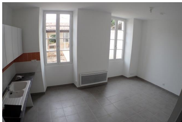
Pièce de vie d'un logement à Jarnac

La rénovation d'un bâti ancien permet également d'entrer dans un logement qui porte une histoire, et le charme des « vieilles pierres ».