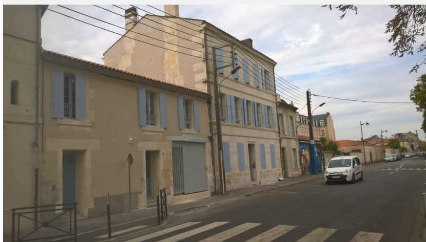
Domicile regroupé de Cognac