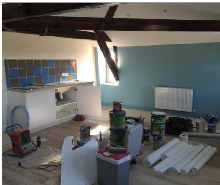
Sous les combles, un T4 de 91 m 2 sera mis en location.

*Sous réserve d'une zone desservie par portage et de l'accessibilité à votre boîte aux lettres.